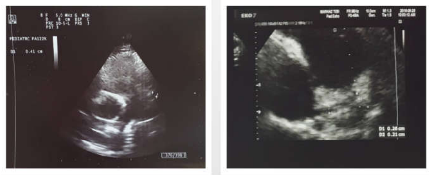
شکل ۲: اکوکاردیوگرافی بیمار و بررسی عروق کرونر. تصویر سمت راست: اکوکاردیوگرافی اولیه که سایز عروق LAD نرمال می‌باشد. تصویر سمت چپ: اکوکاردیوگرافی پس از دو روز که در آن اکتازی LAD مشهود است.

یافت و سپس دوز اسپرین به (۳ mg/kg) کاهش داده شد. در پیگیری‌های بعدی، در هفته ششم، علائم بیمار کاملاً از بین رفته بود و تظاهر جدیدی نداشت و در اکوکاردیوگرافی اتساع شاخه اصلی کرونری چپ کاهش داشت.