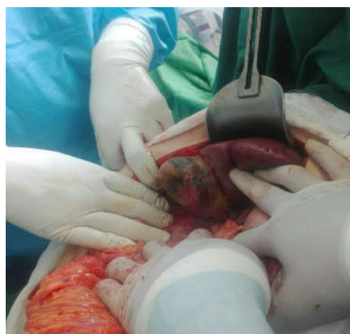
شکل ۳: گرافی کیسه صفرا حین عمل کوله سیستکتومی که گانگرنه و نکروزه است.

اورژانس مراجعه کرده بود و با تشخیص کوله سیستیت آمفیزماتو تحت کوله سیستکتومی اورژانس قرار گرفته بود، معرفی می شود. کوله سیستیت آمفیزماتو با کوله سیستیت حاد ناشی از سنگ از نظر پاتولوژی و اپیدمیولوژی تفاوت دارد. ۶ کوله سیستیت حاد و مزمن معمولاً به دلیل انسداد گردن کیسه صفرا با سنگ صفراوی ایجاد می شوند، در حالی که کوله سیستیت آمفیزماتو به دلیل نکروز کیسه صفرا ناشی از انسداد یا ترومبوز شریان سیستیک رخ می دهد. ۷ اگر کوله سیستیت آمفیزماتو درمان نشود، بیماری پیشرفت کرده و سبب گانگرن احشاء می شود. میکروارگانیزمها به صورت هماتوزن در عضلات پنخس شده و منجر به شوک سپتیک می شوند. ۸ کوله سیستیت امفیزماتو معمولاً به دلیل افزایش بروز گانگرن و پرفوراسیون جدار کیسه صفرا مورتالیتی بالایی دارد که بین ۱۵ تا ۲۰٪ متغیر است، هرچند تشخیص و درمان زود هنگام در بهبود وضعیت بیمار موثر است. ۷ در مطالعه‌ای که توسط Sayit انجام شد در آزمایشات فرد مبتلا به کوله سیستیت آمفیزماتو، لکوسیتوز با افزایش درصد نوتروفیل و همچنین افزایش سطح بیلی روبین توتال و مستقیم گزارش شد. در مطالعه‌ای دیگر نیز لکوسیتوز به همراه افزایش درصد نوتروفیل، افزایش امینوترانسفرازها و بیلی روبین گزارش شد. ۹ در مطالعه حاضر نیز لکوسیتوز با افزایش درصد نوتروفیل و همچنین