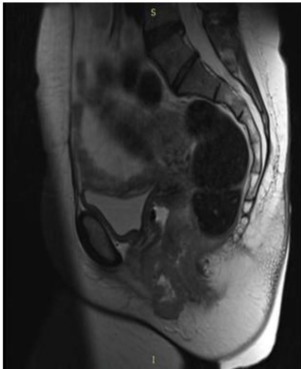
تصویر ۲: (A) نمای توده در تصاویر T2 سائیتال به صورت high signal است.