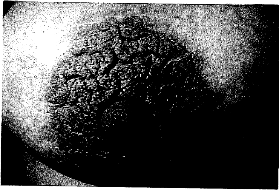
شکل ۱- هیپرکراتوز دو طرفه نیپل و آرنول