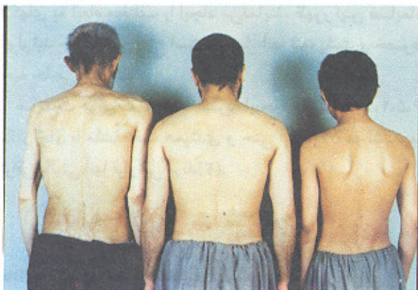
شکل ۳- ضایعات آلبوپاپولوتید در سه عضو خانواده مبتلا به اپیدر مولیز بولوزپاسینی

در بیوپسی به عمل آمده از ضایعات تاولی، بول زیراپیدرم همراه ازودیلاتاسیون عروق، در نمونه برداری از ضایعات اسکار مانند، آتروفی اپیدرم همراه پرولیفراسیون و هموژنیزاسیون بافت کلاژن درم دیده شد.