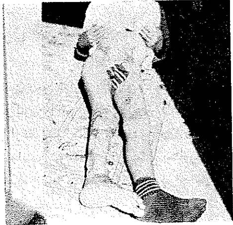
شکل ۲- بیمار پس از عمل جراحی و بهبودی