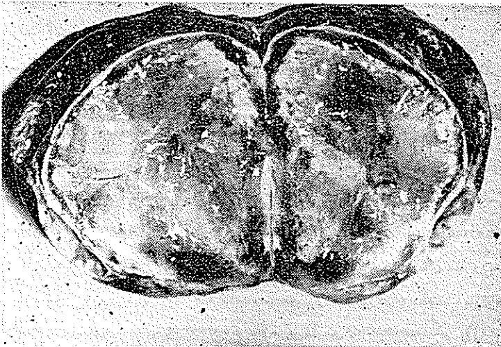
شکل‌های شماره ۳ و ۴

حالت عمومی بیمار خوب- آنمی و سوء تغذیه ندارد در معاینه شکم عضلات جدار بعلت زایمان های مکرر آتروفی و فوق‌العاده نازک شده است در شکم بیمار توموری لمس میشود و بعلت نازکی جدار با چشم نیز بخوبی دیده میشود توموری است با اندازه مشت نیمه باز، سفت و کاملاً مدور دارای پدیکول بلند و آزاد که بر راحتی در شکم حرکت میکند و بر حسب وضع بیمار در موقع ایستادن در لگن و در