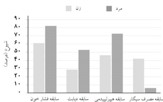
نمودار-۱: عوامل خطر در بیماران عروق کرونر (با و بدون درگیری عروق کلیه)

قابل ملاحظه (RAS) و سایر بیماران (جدول ۲)، مشخص شد که نسبت جنسی زن به مرد در گروه مبتلا به RAS به طور معنی‌داری بالاتر از گروه دیگر بود ( p=0/001 ) (نمودار ۲). بیماران دارای RAS از میانگین سنی بالاتری نسبت به گروه دوم برخوردار بودند ( p<0/001 ). در مقایسه عوامل خطر بیماری عروق کرونر بین بیماران واجد RAS و بیماران فاقد این عارضه، مشخص شد که سابقه ابتلا به فشارخون بالا و ابتلا به دیابت در گروه RAS به طور معنی‌داری بالاتر