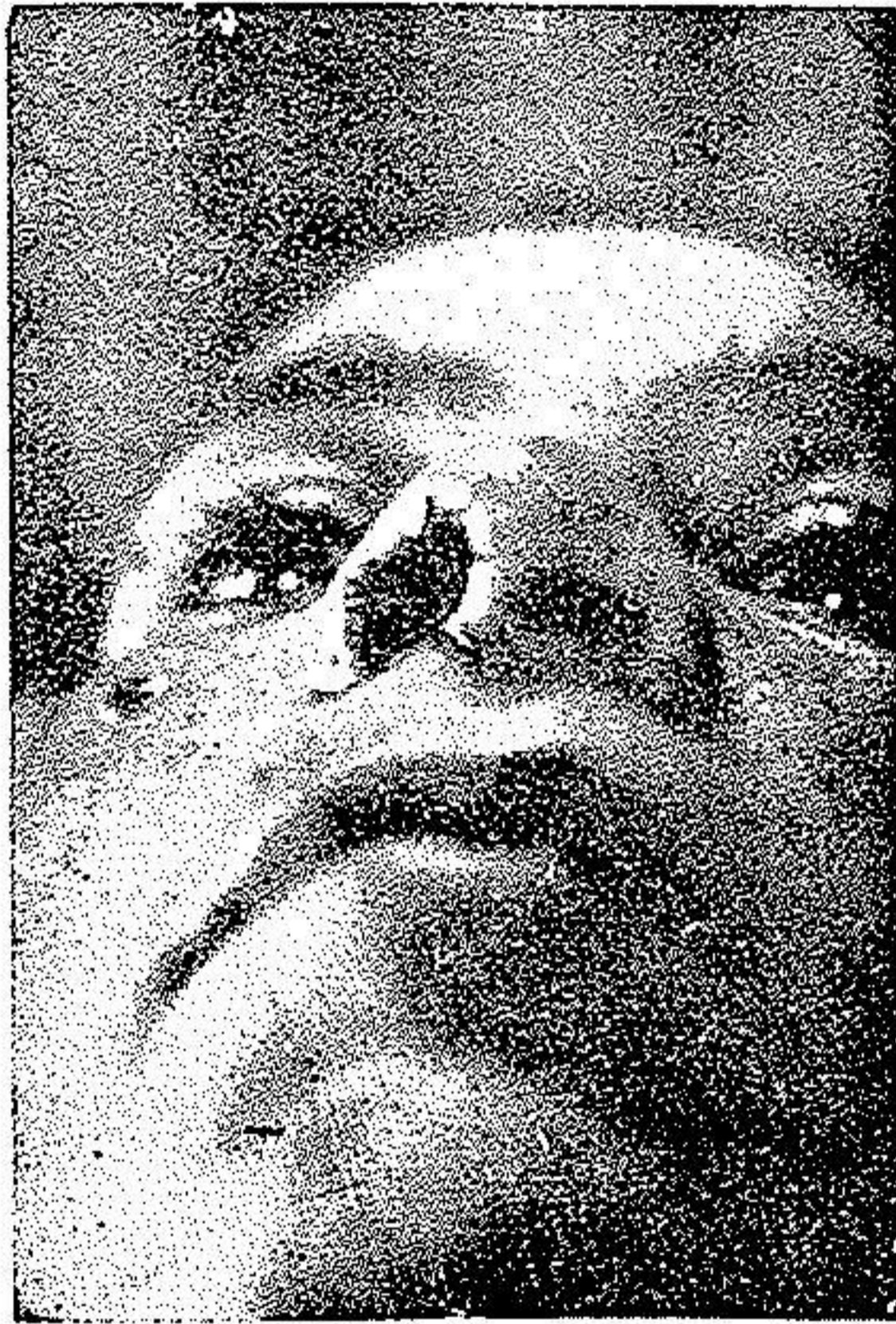
همان بیمار پس از عمل