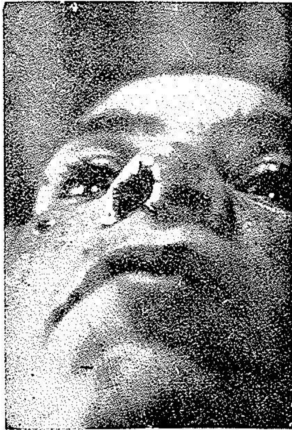
همان بیمار پس از عمل