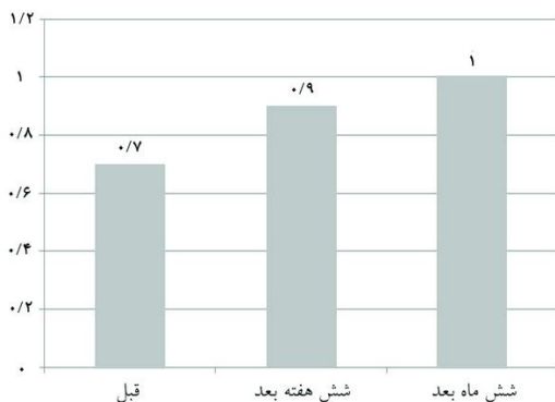
نمودار ۱: میزان جابه‌جایی ولار برحسب میلی‌متر در زمان‌های مختلف ( P = 0/049 )

میانگین سن افراد مورد بررسی 16/1 \pm 1/2 سال در محدوده سنی ۱۵-۱۹ سال بود. میزان جابه‌جایی ولار شش ماه پس از تزریق 1/0 \pm 0/3 میلی‌متر بود که در مقایسه با قبل از تزریق و شش هفته پس از تزریق کاهش معناداری را نشان داد ( P = 0/049 ) (نمودار ۱). شش هفته پس از تزریق افزایش جابه‌جایی ولار در ۱۰ نفر ( 66/7\% ) مشاهده شد. شش هفته پس از تزریق سایز Gap در دو نفر ( 13/3\% ) بدون تغییر، چهار نفر ( 26/7\% ) کاهش و در ۹ نفر ( 60\% )