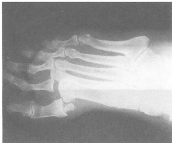
شکل ۲ - شکستگی سزامونید لترال.

بیمار مرد ۸۰ ساله دیابتیک است که به دنبال عبور چرخ اتوموبیل از روی پایش دچار درد و تورم شده و به اورژانس مراجعه می نماید. در معاینه به عمل آمده علاوه بر درد و تورم در پا، دفرمیت در انگشتان اول و دوم پا به صورت دورسی فلکشن دفرمیت مشاهده شد. در رادیوگرافی های به عمل آمده، در رفتگی دورسال مفاصل متاتارسوفالانژیال اول و دوم مشهود بود (شکل ۱- الف و ب).