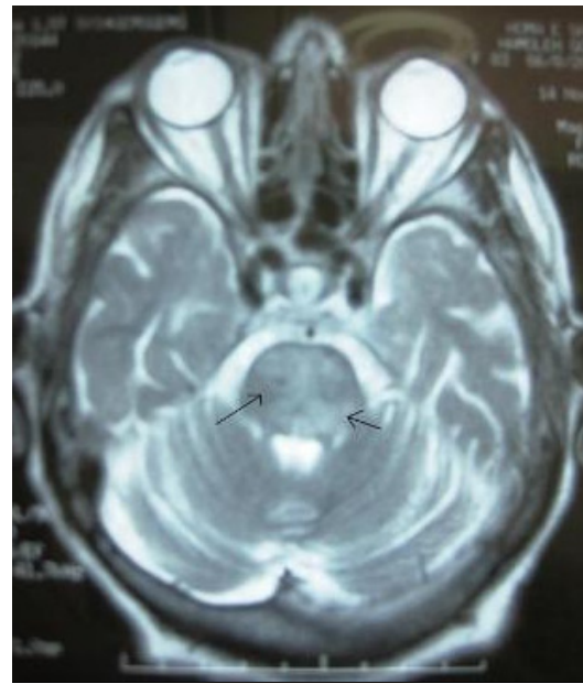
شکل - ۱: نمایی از MRI مغز بیمار در بدو ورود که ضایعاتی Hyper intense بدون Enhancement در ناحیه Pons مشهود است.

بهبودی مطلوب بیمار روزانه ۵۰۰mg متیل پردنیزولون برای پنج روز به درمان وی اضافه شد. پس از آن بیمار در طی سه ماه سیر بهبودی را طی کرد. پس از دو سال بیمار قادر است با کمک عصا راه برود و همچنین قدرت عضلانی وی به حد مطلوب رسیده است. در بررسی MRI مغز بیمار نواحی Hyper intense از بین رفته است (شکل ۲).