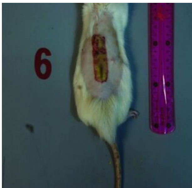
شکل ۵: زخم در روز پانزدهم در گروه سیلور سولفادیازین