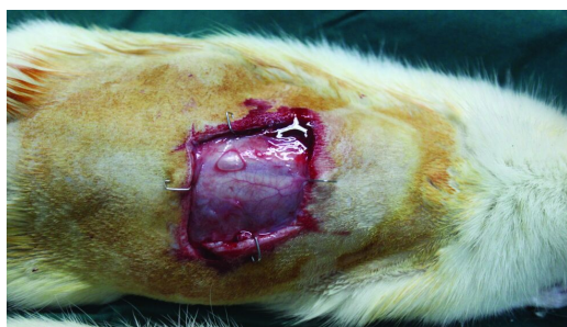
شکل ۲: آمنیون آسلولار با سلول بنیادی مزانشیمی چربی روی زخم