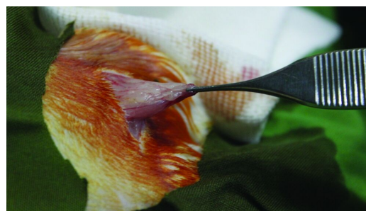
شکل ۱: برداشتن چربی اینگوینال برای تهیه سلول بنیادی