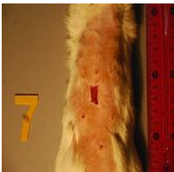
شکل ۳: زخم در روز پانزدهم در گروه آمنیون آسلولار با سلول بنیادی