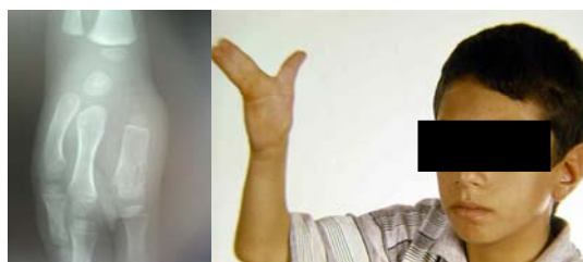
شکل - ۱: بیمار ۱۲ ساله با سینداکتیلی انگشتان