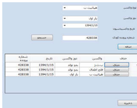
شکل ۱: صفحه ثبت داده‌های واکسیناسیون