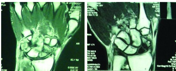
شکل- ۳: سمت راست نمونه مقطع T1 با کاهش سیگنال در قطعات پروگزیمال و دیستال اسکافوئید. سمت چپ نمونه مقطع T1 با کاهش سیگنال پراکنده و خفیف