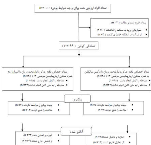
شکل ۱: فلوجارت بیماران

اریتروماسین موضعی ۴٪، به مدت سه ماه تحت درمان قرار گرفتند. تمامی بیماران از نظر هلیکوباکتریلوری آزمایش شدند تا پایان مطالعه از نظر ارتباط با درمان مورد بررسی قرار گیرند.