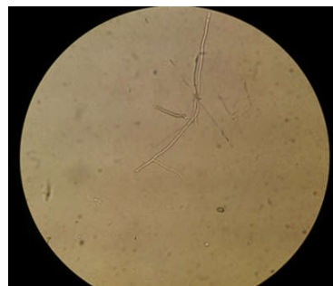
شکل ۱: عناصر رشته‌ای قارچی در آزمایش مستقیم تراشه‌های قرنیه با محلول پتاس ۱۰٪ (بزرگ‌نمایی ۴۰۰)

نمونه‌ها تنها در ۱ (۱/۸٪) مورد عناصر قارچی به صورت میسلیم‌های شفاف و منشعب مشاهده شد (شکل ۱). در این مطالعه کلنی‌های قارچی در ۹ (۱/۱۶٪) مورد در محیط‌های کشت رشد نمود که پس از بررسی‌های قارچ‌شناسی، ایزوله‌ها به ترتیب فراوانی به‌عنوان گونه‌های فوزاریوم (چهار مورد)، اسپرژیلوس فلاووس (دو مورد)، گونه‌ی کلادوسپوریوم (یک مورد)، گونه‌ی پنی‌سیلیوم (یک مورد) و گونه‌ی آکرومونیم (یک مورد) شناسایی شدند (شکل ۲). در این مطالعه بیماران مبتلا به کراتیت قارچی شامل هفت مرد و دو زن با میانگین سنی ۶۲/۹ سال بودند (شکل‌های ۳ و ۴). ترومای قرنیه یافته‌ی شایعی در مطالعه‌ی کنونی بود (جدول ۲) به نحوی که از میان ۹ بیمار مبتلا به کراتیت قارچی، ۸ (۸۸/۹٪) نفر سابقه‌ی ترومای قرنیه