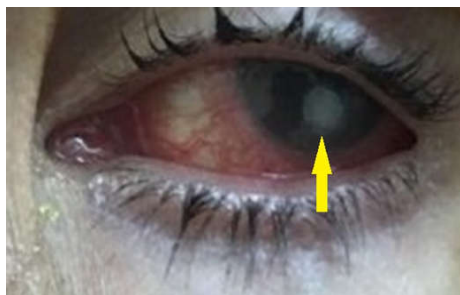
شکل ۳: تصویر ضایعه‌ی بالینی یک مورد کراتیت ناشی از گونه فوزاریوم