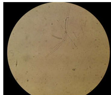
شکل ۱: عناصر رشته‌ای قارچی در آزمایش مستقیم تراشه‌های قرنیه با محلول پتاس ۱۰٪ (بزرگ‌نمایی ۴۰۰)

نمونه‌ها تنها در ۱ (۱/۸٪) مورد عناصر قارچی به صورت میسلیم‌های شفاف و منشعب مشاهده شد (شکل ۱). در این مطالعه کلنی‌های قارچی در ۹ (۱/۱۶٪) مورد در محیط‌های کشت رشد نمود که پس از بررسی‌های قارچ‌شناسی، ایزوله‌ها به ترتیب فراوانی به‌عنوان گونه‌های فوزاریوم (چهار مورد)، اسپرژیلوس فلاووس (دو مورد)، گونه‌ی کلادوسپوریوم (یک مورد)، گونه‌ی پنی‌سیلیوم (یک مورد) و گونه‌ی آکرومونیم (یک مورد) شناسایی شدند (شکل ۲). در این مطالعه بیماران مبتلا به کراتیت قارچی شامل هفت مرد و دو زن با میانگین سنی ۶۲/۹ سال بودند (شکل‌های ۳ و ۴). ترومای قرنیه یافته‌ی شایعی در مطالعه‌ی کنونی بود (جدول ۲) به نحوی که از میان ۹ بیمار مبتلا به کراتیت قارچی، ۸ (۸۸/۹٪) نفر سابقه‌ی ترومای قرنیه