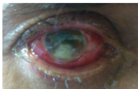
شکل ۴: تصویر ضایعه بالینی یک مورد کراتیت ناشی از اسپرژیلوس فلاووس