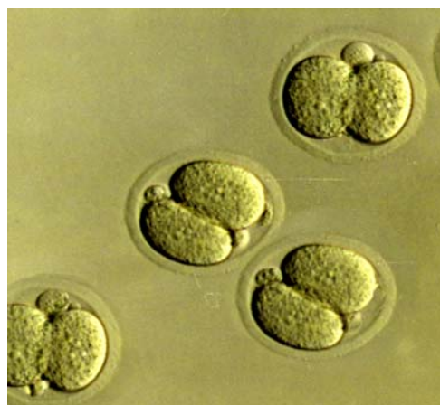
تصویر-۱: جنین‌های به‌دست آمده در مرحله دو سلولی.