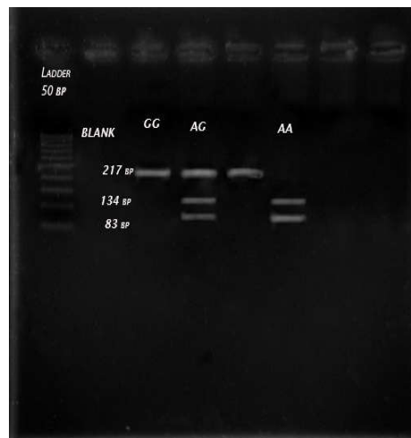
شکل ۱: الگوهای ژنوتایپینگ مربوط به پلی مورفیسم (rs1929992) اینترلوکین ۳۳ با استفاده از تکنیک PCR-RFLP

مطلوبی انجام گردید. واکنش زنجیره ای پلیمرز PCR با استفاده از دستگاه ترموسایکلر Applied Veriti™ Thermal Cyclers (Applied Biosystems, Foster City, CA, USA) تحت شرایط دمایی و زمانی مشخص انجام گردید.