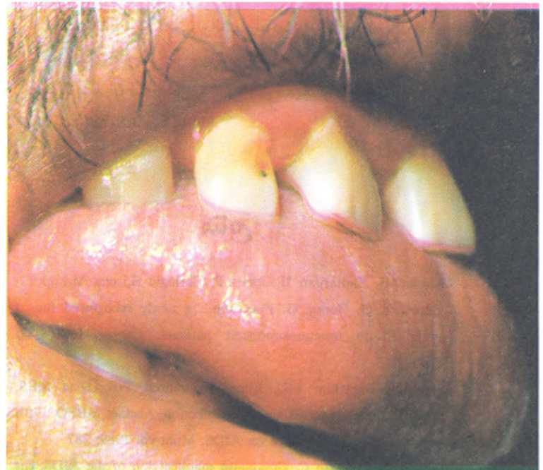
تصویر ۱- ضایعه کاندیدا روی زبان

آزمایش یکصد و چهار نمونه آزمایشگاهی از مجموع چهارصد و چهارده نمونه آزمایشگاهی جمع‌آوری شده نیز، دارای نتیجه منفی بود که این تعداد نمونه، ۲۵٪ کل نمونه‌های جمع‌آوری شده را تشکیل می‌داد.