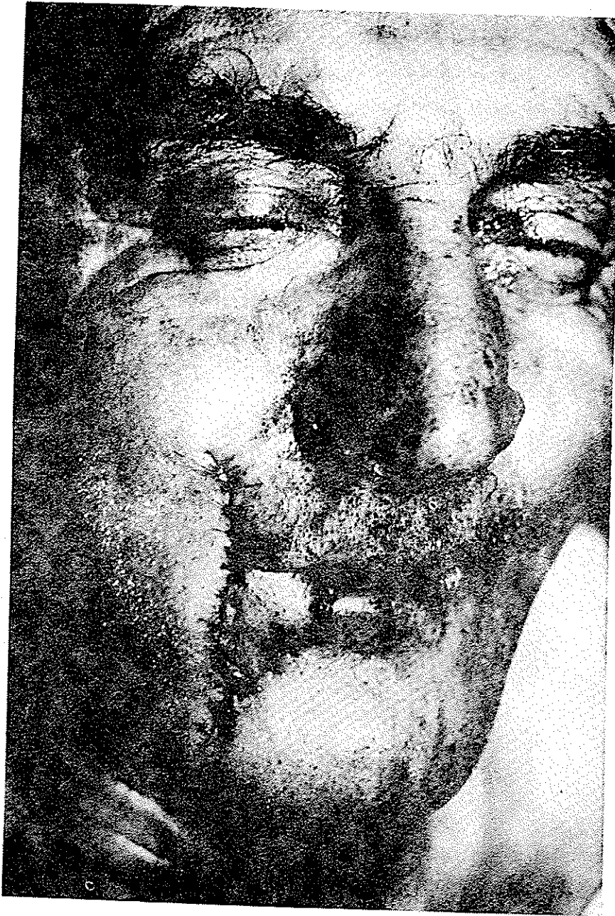
۲- ABBE FLAP (۱-۱۶):

تمام لایه تا ورمیلیون قطع و از طرف دیگر تمام لایه تا نزدیکی ورمیلیون خط برش را متوقف بطوریکه شریان لابیال در داخل پدیкул قرار داشته باشد و پس از آماده کردن فلاپ از لب بالا آنرا با اندازه ۱۸۰ درجه به پائین چرخانده و در داخل دیفکت برش تومور قبلی قرار می دهیم و دیفکت ایجاد شده از فلاپ بالا را در سه لایه دوخته و فلاپ را نیز در پائین در سه لایه