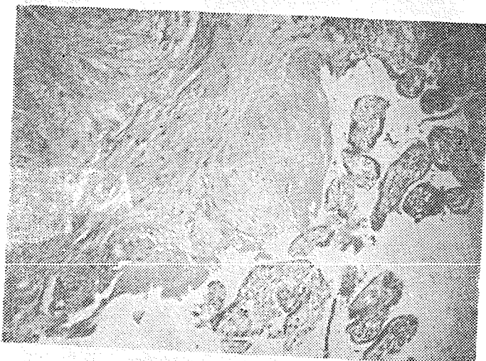
عکس شماره ۱ - نمای میکروسکوپی پلاسنٹا اکرتا ، فقدان دسیدوا و وجود پرزهای کوریون را چسبیده به رشته های عضلانی نشان میدهد .

از نظر آسیب شناسی در این عارضه پرزهای کوریون بعضلات