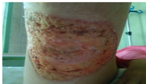
شکل ۳: ضایعه چند روز پس از شروع کورتون، بهبود تدریجی ضایعه پس از شروع کورتیکواستروئید