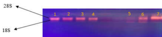
شکل ۱: الکتروفورز بر روی ژل آگارز برای بررسی کیفیت RNA استخراج شده. شماره ۱-۶: نمونه‌ها، شماره ۷: مارکر.

نسبت جذب ۲۶۰ به ۲۸۰ nm تعیین کننده خلوص اسیدهای نوکلئیک می‌باشد و در پژوهش کنونی، این نسبت جذب، بین ۱/۸ تا ۲ بود و کیفیت RNAهای استخراج شده، تایید شد. میزان کارایی