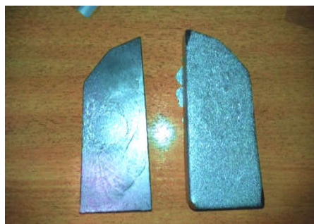
شکل ۱: تصویر بلاک‌های ریوی

گردن در حد تیروئید، لوب میانی ریه، شکم در حد ناف، لگن در استخوان سمفیز پویس، وسط ران، زانو و ساق پا اندازه‌گیری شد. ۱۱ به منظور تابش‌دهی، فانتوم روی تخت TBI و در فاصله ۳۱۲ سانتی‌متری نسبت به منبع پرتو و پنج سانتی‌متری نسبت به اسپویلر در موقعیت به پهلو قرار گرفت. فانتوم به شکلی موقعیت‌دهی شد که محور مرکزی دسته پرتو در امتداد ناف واقع شود. به منظور حفاظت ریه‌ها در برابر دریافت پرتو مازاد، شیلدهای ریوی روی دیواره تخت (اسپویلر) و در محدوده ریه‌ها نصب شدند.