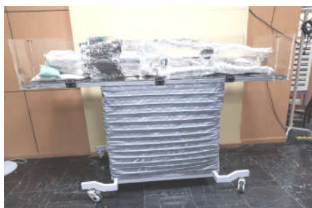
شکل ۲: تابش‌دهی فانتوم شبه انسان با هندسه قدامی خلفی مقابل موازی و نمای ظاهری تخت TBI