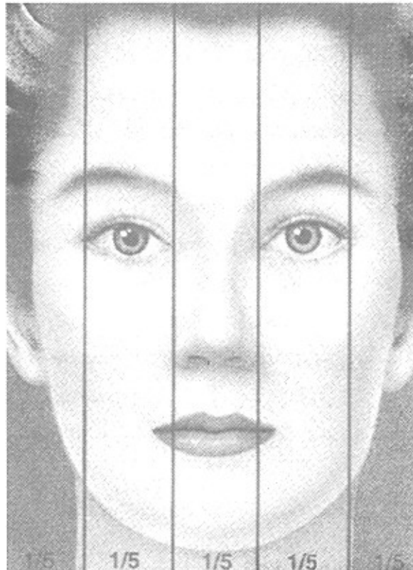
شکل شماره ۱- پهنای صورت: براساس پهنای صورت نرمال که مساوی ۵ فاصله اینترکانتال میباشد

استخوان بینی در ناحیه base در ۱۸ بیمار ۲۱/۹٪ طبیعی، در ۲۳ بیمار (۲۸٪) پهن ۳۹ (۴۷/۵٪) باریک ۲ و در ۲ بیمار ۲/۴٪ منحرف بود.