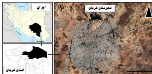
شکل ۱: نقشه محل مورد مطالعه، شهر کرمان، استان کرمان، جنوب شرقی ایران

از مجموع ۲۸۵۰ دانش‌آموز که توسط پژوهشگر معاینه شدند ۱۷۹ عدد پرسشنامه تکمیل گردید، ۱۱۹ دانش‌آموز از ناحیه یک آموزش و پرورش ( 10/08 \pm 0/027 ) و ۶۰ دانش‌آموز از ناحیه دو