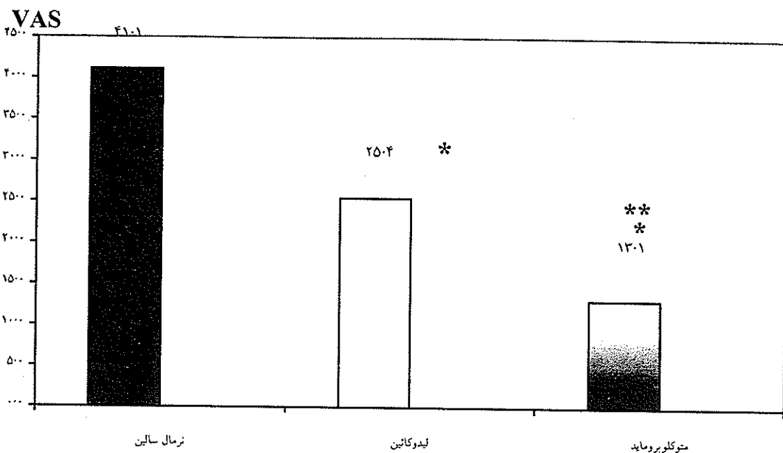
نمودار شماره ۱- شدت درد در سه گروه نرمال سالین، لیدوکائین و متوکلوپرواماید. مقادیر به صورت میانگین \pm VAS ذکر شده اند. * تفاوت معنی دار در مقایسه با گروه نرمال سالین ( P < 0.05 , Mann-Whitney). ** تفاوت معنی دار در مقایسه با گروه لیدوکائین ( P < 0.05 , Mann-Whitney). Visual Analogue Scale :VAS \pm