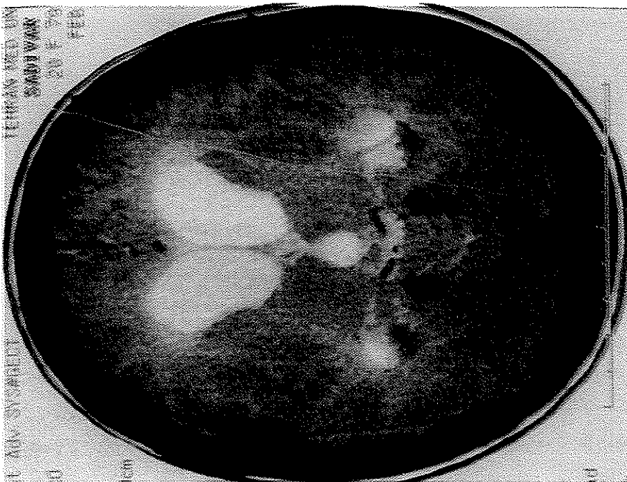
تصویر شماره ۲- کاهش پنوموسفالوس نسبت به سی تی اسکن قبلی