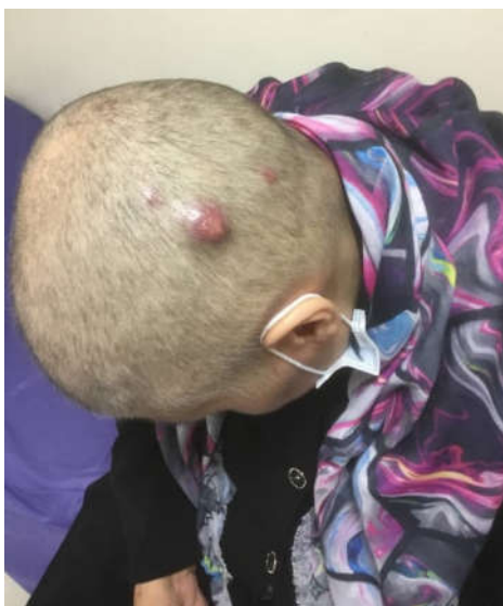
شکل ۲: متاستاز پوستی ناشی از سرطان پستان با تظاهر آلوپسی نئوپلاستیک