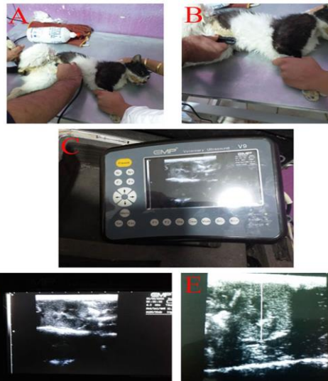
شکل ۱: تعیین محل کلیه با استفاده از سونوگرافی برای دو مرحله تزریق سلول در روزهای ۱ و ۱۴. (A) آماده کردن حیوان برای سونوگرافی و قراردادن آن در موقعیت مناسب. (B) پیدا کردن محل دقیق کلیه با استفاده از سونوگرافی. (C) تصویر کلیه گربه در دستگاه سونوگرافی مورد استفاده در این پژوهش (دستگاه سونوگرافی EMP ساخت کشور چین). (D) بررسی وضعیت دقیق کلیه حیوان مبتلا به بیماری مزمن کلیه با استفاده از امواج سونوگرافی. (E) تعیین محل دقیق تزریق سلول به کلیه که با خط سفید رنگ در تصویر نشان داده شده است.

گروه کنترل هیچ درمانی دریافت نکردند. گروه نرمال نیز در بیمارستان دامپزشکی برای معاینات معمول مراجعه می کردند. برای همه حیوانات، معاینه فیزیکی حیوانات، آزمایش اندازه گیری BUN، اوره، کراتینین سرم و ALT در روزهای ۱، ۳۰، ۶۰، ۹۰ و ۱۲۰ انجام شد. برای ارزیابی عملکرد کلیه از وزن مخصوص ادرار (SG) استفاده شد که مقدار کمتر از ۱/۰۳۵ در گربه ها نشان دهنده مشکلات کلیوی است. داده ها با استفاده از تحلیل واریانس دو طرفه (ANOVA) برای مقایسه های چندگانه با استفاده از SPSS software, version 20 (SPSS Inc., Chicago, IL, USA) و آزمون توکی مورد تجزیه و تحلیل قرار گرفت. سطوح P < 0.05 از نظر آماری معنادار در نظر گرفته شد.