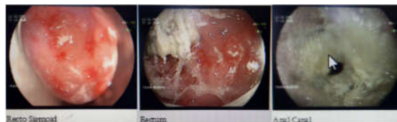
شکل ۱: به‌ترتیب از چپ به راست نماهای رکتوسیگموئید، رکتوم و آنال با نواحی ملتهب اصطلاحاً skip منطبق با بیماری کرون

سپس دبیردهان نسوج نکروتیک انجام گرفت. با توجه به آلودگی ناحیه تصمیم به کولوستومی حمایتی گرفته شد تا پس از شش ماه دیگر بسته شود. در موعد معین طی کولونوسکوپی انجام گرفته، گاستروانترولوژیست کودکان متوجه التهاب گسترده در