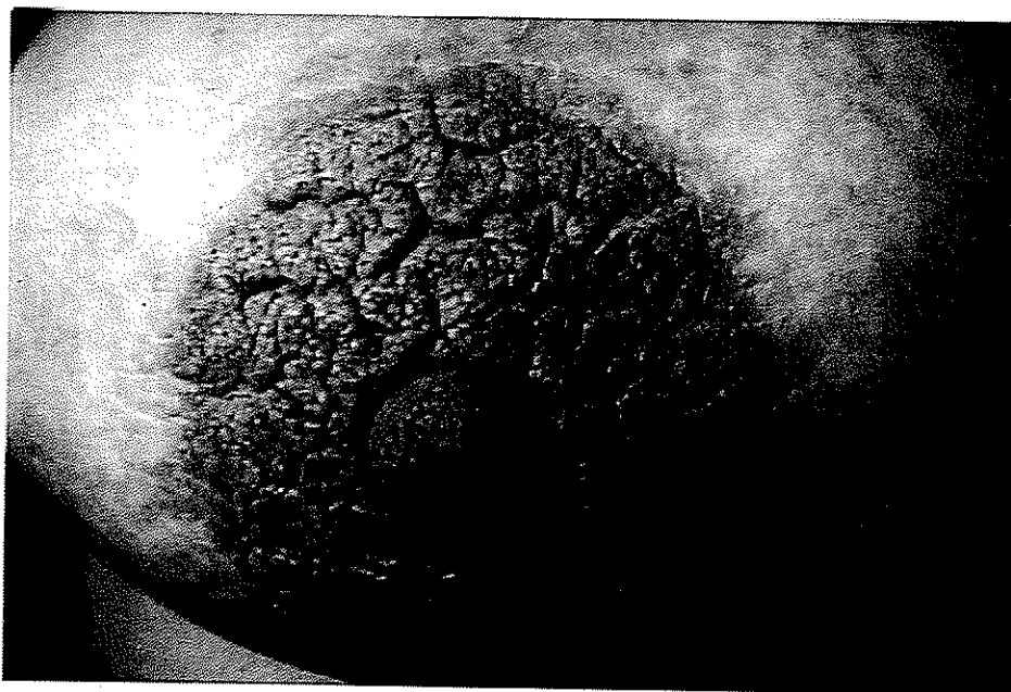
شکل ۱- هیپرکراتوز دو طرفه نیپل و آرنول