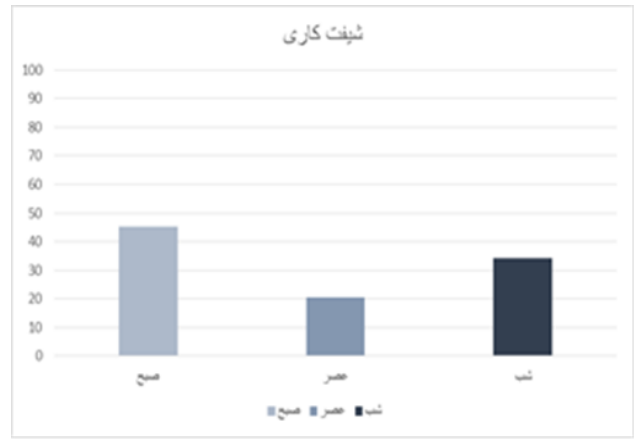
نمودار ۱: توزیع فراوانی خطای پزشکی به تفکیک زمان رخداد (شیفت)

علت ماهیت آموزشی بیمارستان موردبررسی و امکان کاهش تمرکز کادر درمانی به علت این افزایش تمرکز افراد باشد. با این حال در مطالعات بسیاری شبکاری یکی از فاکتورهای خطر بروز خطای پزشکی، به علت خستگی پرستاران، بوده است. برای مثال مطالعه Soleimani و همکاران نشان داد افزایش شیفت شب باعث کاهش سلامت عمومی پرستاران می‌شود. ۱۹ و یا در مطالعه دیگری توسط Suzuki و همکاران نیز نشان داده شد که بین شبکاری، کار شبانه پرستاران و خطاهای پرستاری آنها همبستگی وجود دارد. ۲۰