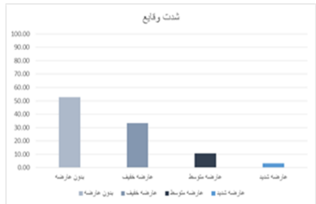
نمودار ۳: توزیع فراوانی خطاهای پزشکی به تفکیک شدت