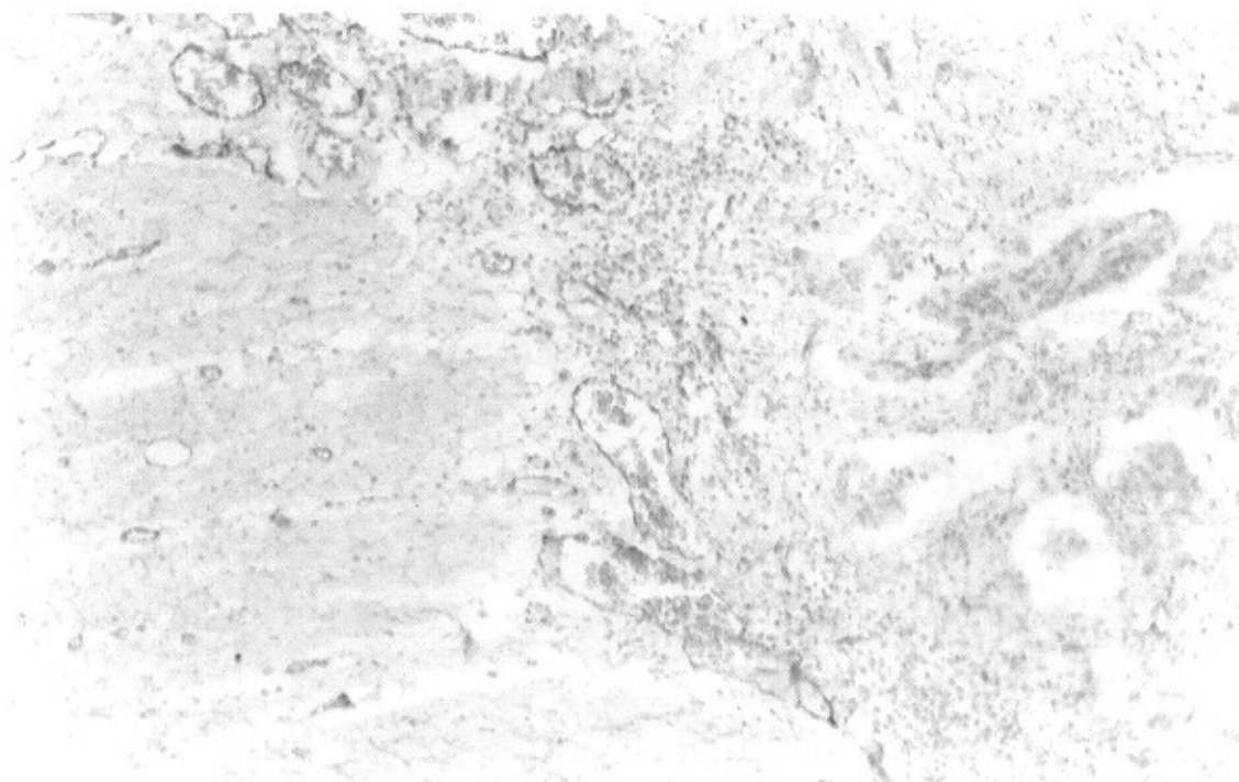
تصویر ۲- نمای عروق در عمق مهاجم کانسر کولورکتال (رنگ‌آمیزی ایمونوهیستوشیمی برای آنتی‌ژن فاکتور VIII، بزرگ‌نمایی \times 100 )