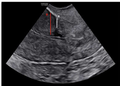
شکل ۱: تصویر TVS از سگمان تحتانی رحم که در آن نشان داده شده است. خط سفید (A) نمایانگر RMT و خط قرمز (B) نمایانگر AMT است.