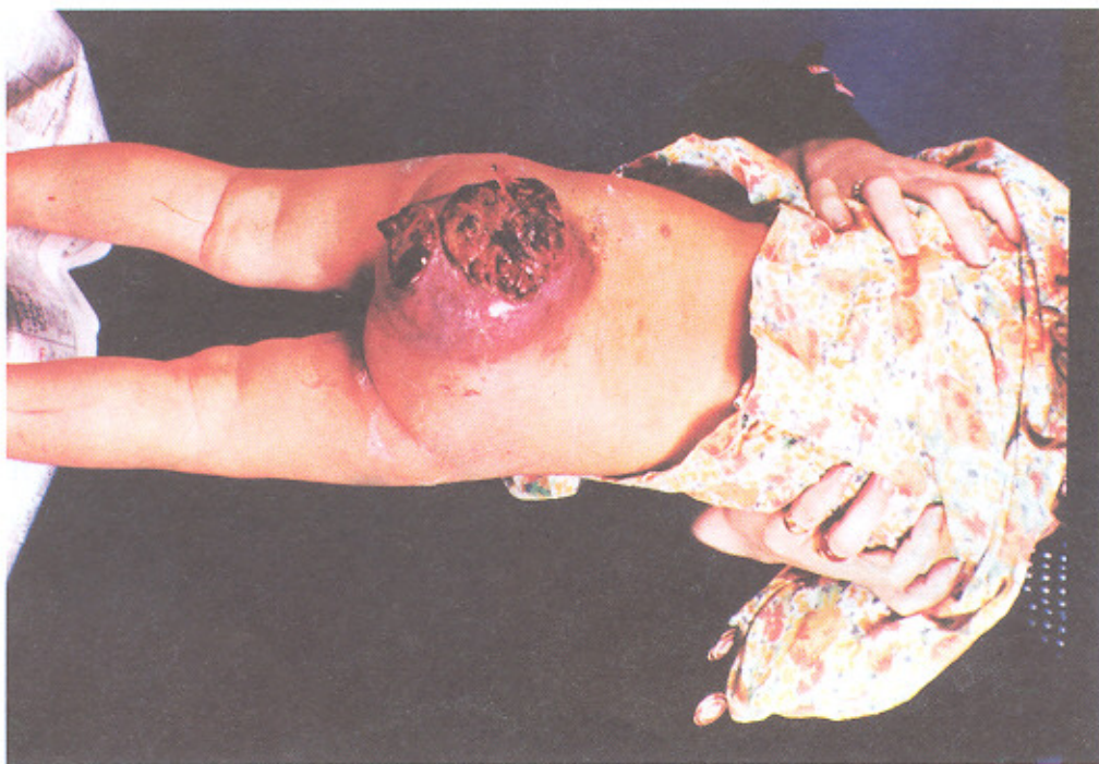
تصویر شماره ۲ - تراتومای بدخیم SC در بیماران بیمارستانهای دانشگاه علوم پزشکی تهران (۱۳۶۱ تا ۱۳۷۸)