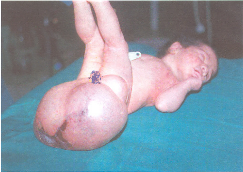
تصویر شماره ۱ - تراتومای کیستیک SC در بیماران بیمارستانهای دانشگاه علوم پزشکی تهران (۱۳۶۱ تا ۱۳۷۸)