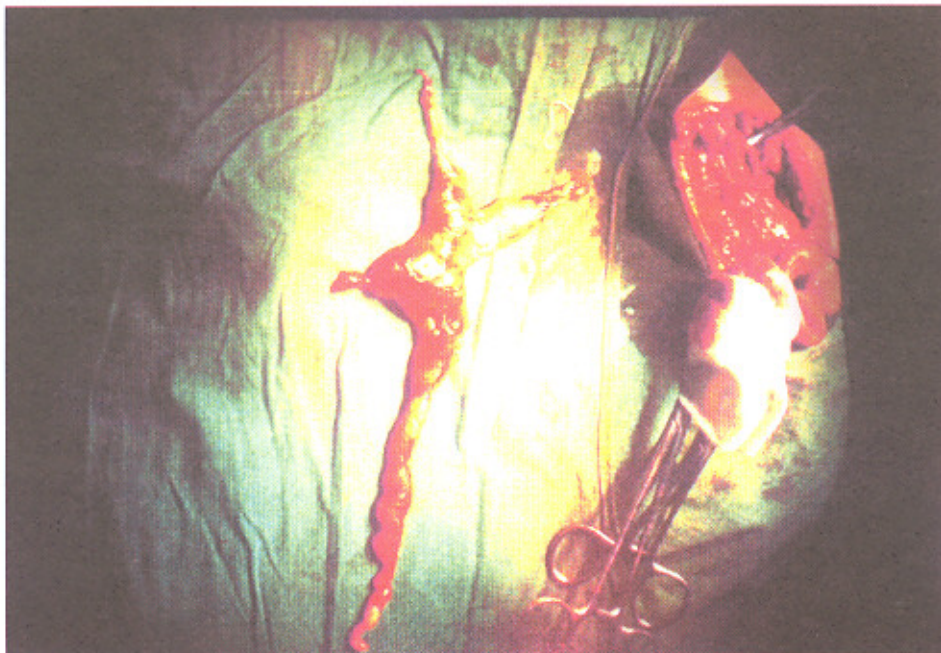
(تصویر شماره ۳) با روش Blunt dissection این استطاله‌ها به همراه تومور اصلی از بافت‌های اطراف آزاد و سپس به صورت کامل رزکت (resect) گردید.