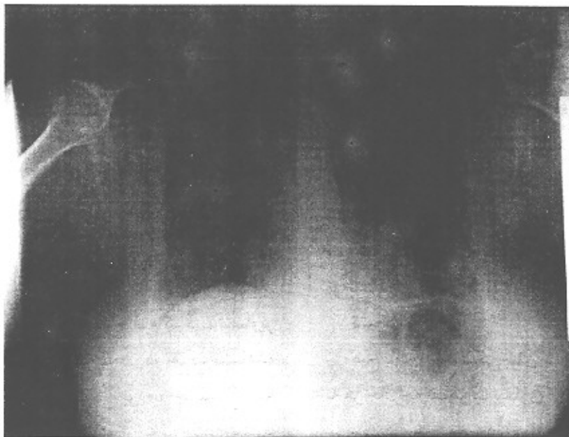
شکل ۲- تصویر رادیوگرافیک بیمار