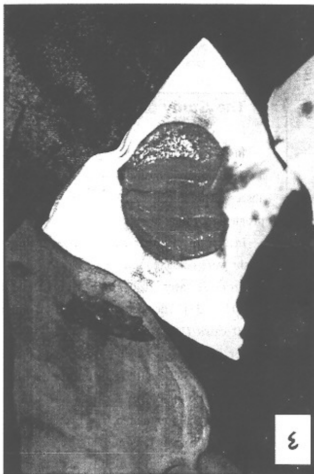
شکل ۴- تصویر نمونه ارسالی

با توجه به اینکه هیچ تست اختصاصی برای رد یا تأیید سارکوئیدوز بطور خاص وجود ندارد و این بیماری را از روی مجموعه شکایات و علائم بالینی و آزمایشگاهی حدس می‌زنند و با کمک نتایج آسیب شناسی به یک جمع‌بندی در مورد امکان اثبات تشخیص بیماری نائل می‌گردند، این مورد نمونه‌ای از تظاهرات غیر معمول سارکوئیدوز در مراجعه به متخصصین گوش و گلو و بینی می‌باشد (۸،۷).