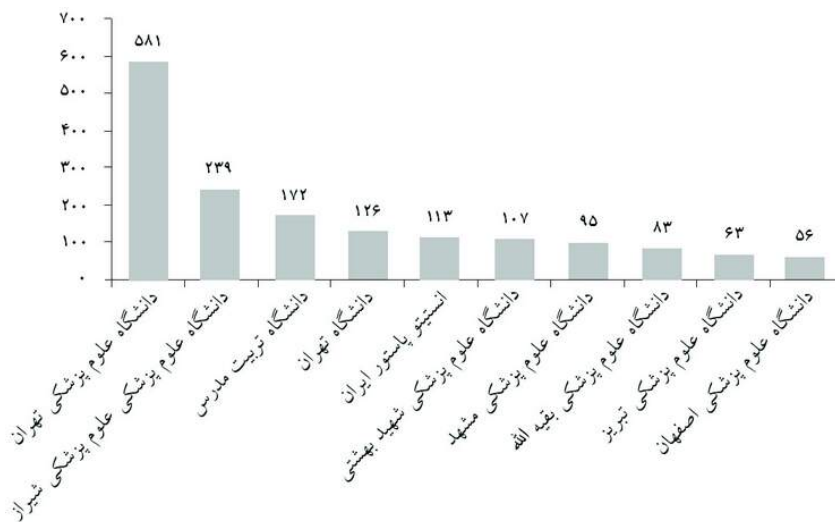
نمودار ۳: رتبه‌بندی وابستگی سازمانی نویسندگان حوزه ایمنی‌شناسی ایران در پایگاه وب آو ساینس