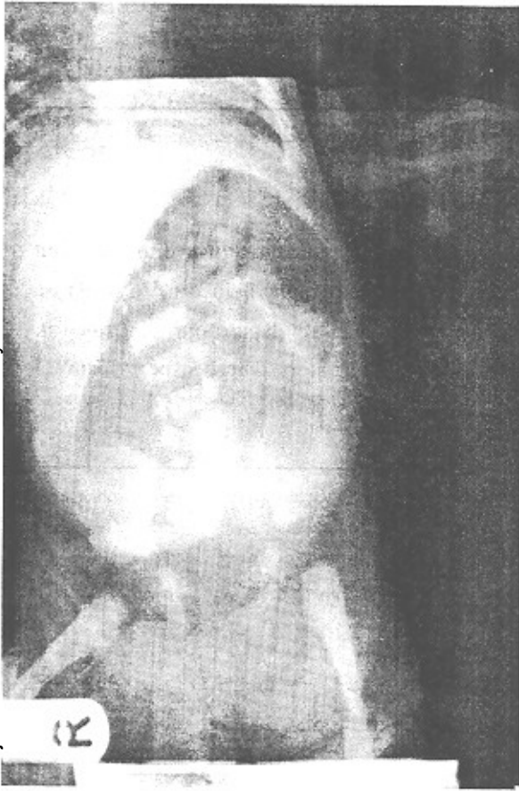
شکل ۲- تصویر رادیوگرافیک نوزاد