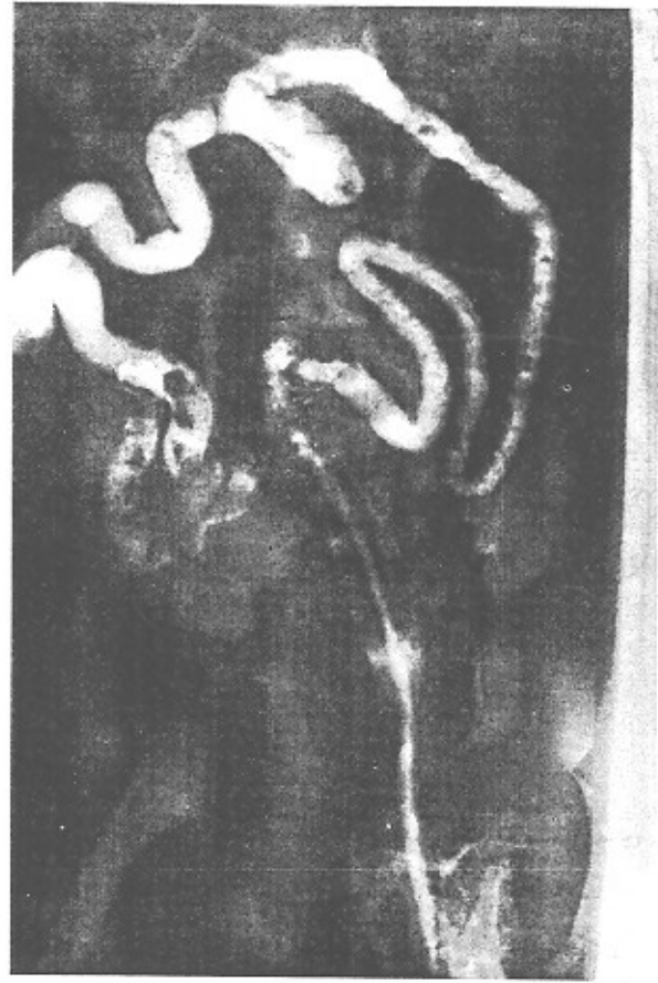
شکل ۳- نمای رادیوگرافیک پس از تنقیه باریوم