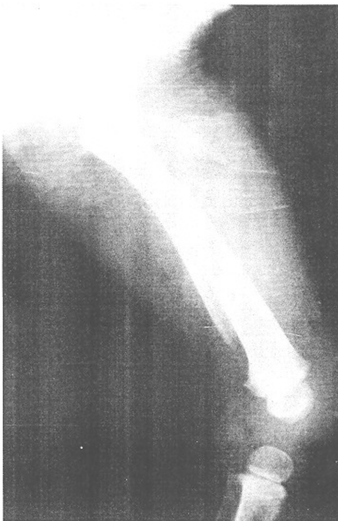
شکل ۱- رادیوگرافی شکستگی تنه استخوان ران در کودک

۴ ساله که با جایجایی و زاویه دار شدن زیاد نیست. با گچ