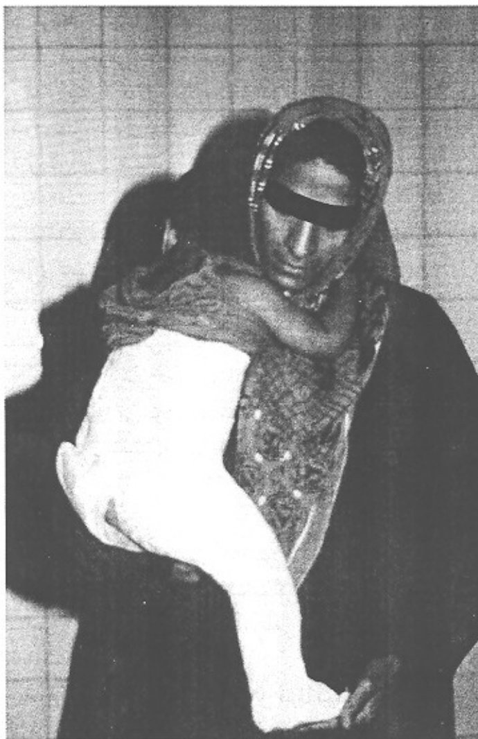
شکل ۳- گچ اسپیکا با خم کردن زانو و مفصل ران بمیزان

۹۰ درجه که بغل کردن بهار برای والدین راحت تر باشد.