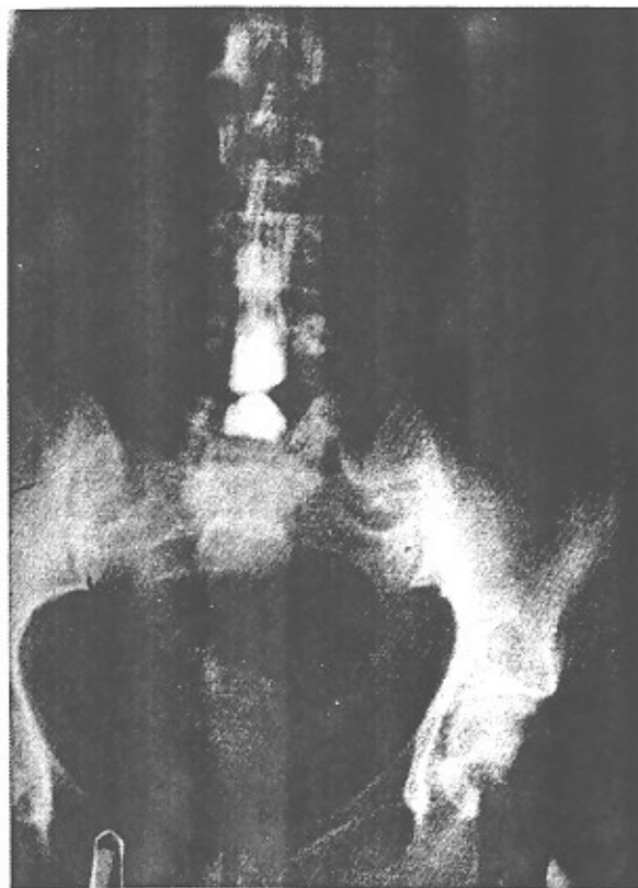
تصویر شماره ۳- عارضه درمان - پارگی دروازه بین لامینکتومی و دیسکتومی لومبر