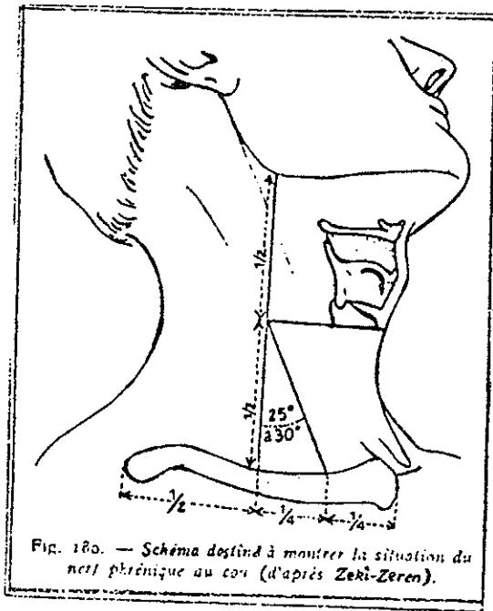
شکل ۱ -

۵۴ نمونه تشریح شده صورت گرفت مبنای اندازه گیری خطی