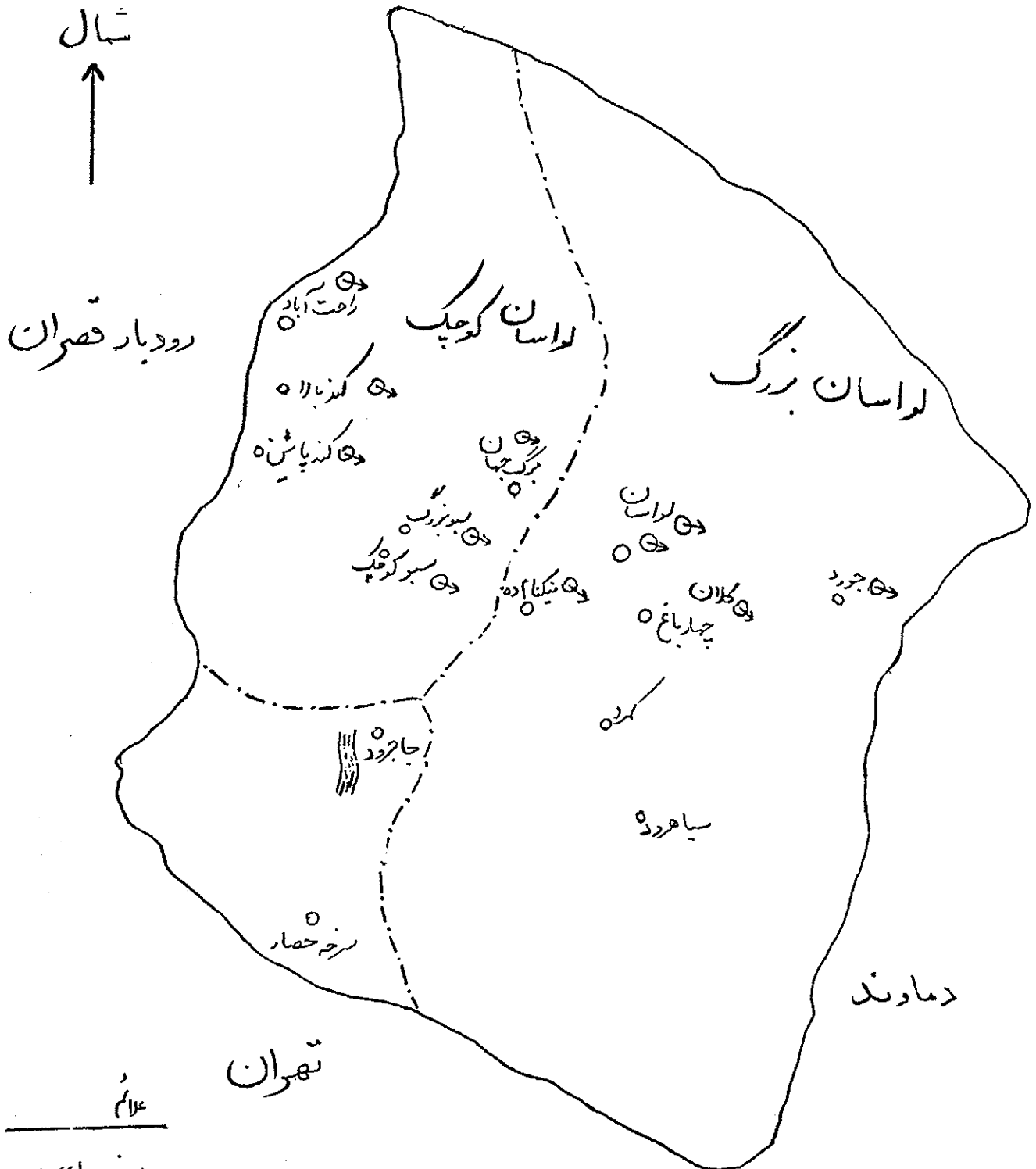
" محل تقریبی نمونه برداری از آبهای خوراکی منطقه لواسانات "

۷ ها بر حسب اشل لگاریتمی درجه بندی شده است که میزان