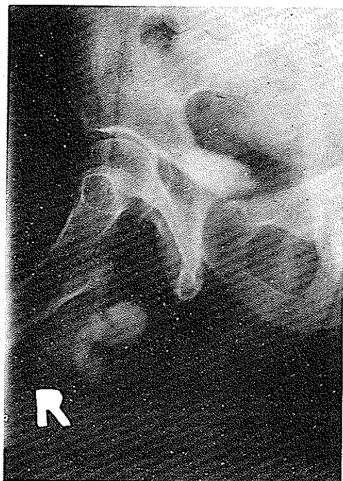
شکل ۴- اورتروگرافی بعد از تخلیه و تصویر سنگ های متعدد دیورتیکول .