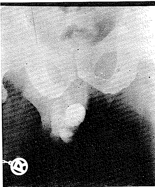
شکل ۲- رادیوگرافی ساده و تصویر سنگها در داخل دیورتیکول

لمس ناحیه مزبور - تحریکات جنسی و نزدیکی هیچگونه دردی ایجاد نمیکرده فقط بیمار اظهار میکند که اغلب چند دقیقه بعد از عمل نزدیکی مقداری از اسپرم باقی مانده بتدریج دفع میگردد . در لمس کناره مجرا ، سفتی بزرگی با اندازه یک نارنگی در مسیر مجرای ادراری و بالای بیضه راست حس میشود که با کمی فشار و دقت کریبیپتاسیون سنگهای متعدد در داخل حفره حس میگردد ( شکل شماره ۱۰ ) در تفتیش مجرا با سوند نایلنی ، هیچگونه گرفتگی در مسیر مجرا دیده نمیشود فقط در قسمت قدامی مجرای ادراری در قسمتی خشونت سنگ ضمن عبور