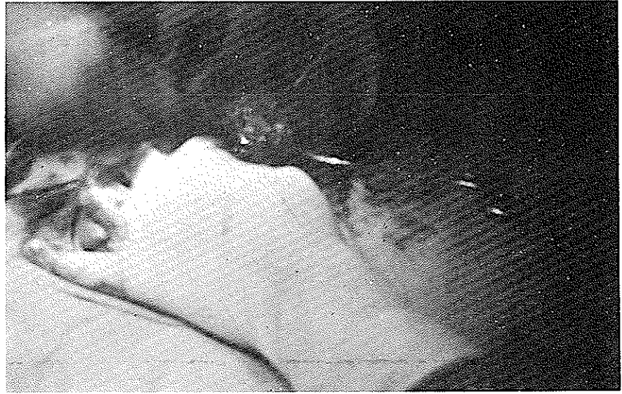
شکل ۶- حفره دیورتیکول باز شده و سنگهای متعدد داخل آن کاملاً نمایان شده است .