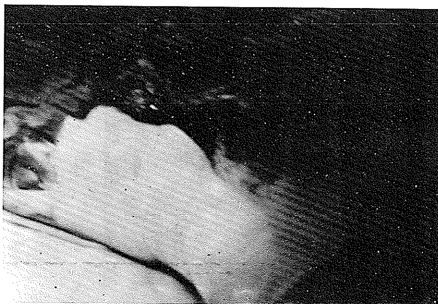
شکل ۵- حفره دیورتیکول مجرای ادراری کاملاً "از نسوج اطراف جدا شده است .