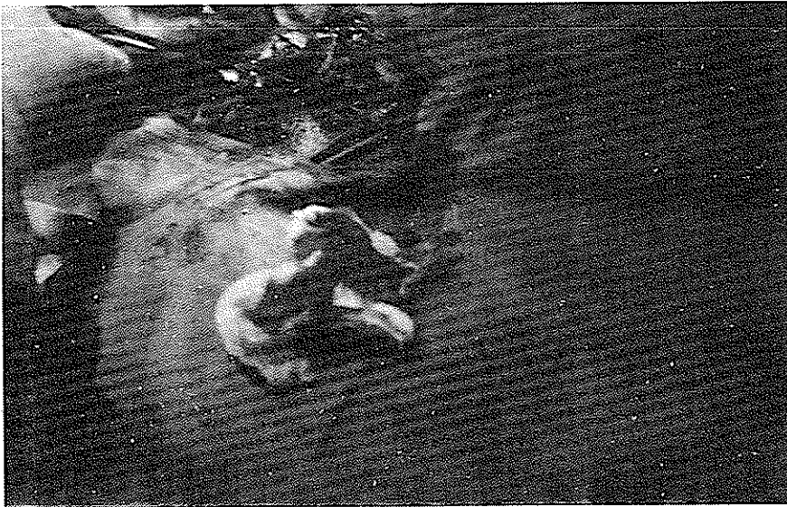
شکل ۷- ۱۵ عدد سنگ از داخل دیورتیکول مجرای ادراری خارج شده و حفره بزرگ کاملاً نمایان است .