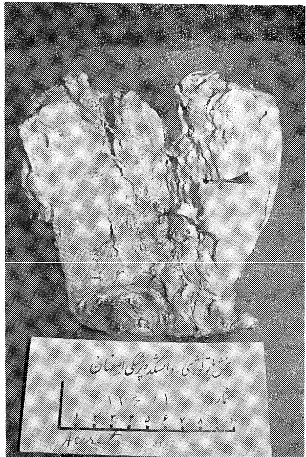
عکس شماره ۴ - پلاسنٹا اکرتا - جفت بین رشته‌های عضلانی جدار زهدان قرار گرفته است.

این رشته‌ها نفوذ کرده پلاسنٹا این کرتا را بوجود می‌آورند (عکس شماره ۴) پلاسنٹا پر کرتا وقتی است که ویلوزیته‌های جفتی از تمامی طبقات جدار زهدان گذشته به طبقه سرو زبر سدوگامی نیز بدرون حفره صفاقی راه می‌یابد (عکس شماره ۵) در این موارد گاهی اسکارهائی قدیمی در طبقه دسیدوا حقیقی دیده میشود که گرچه علت آن نامعلوم است ولی عفونت مزمن و عوامل مکانیکی مانند کورتاژ رادریپدایش آن مؤثر دانسته‌اند [۸].