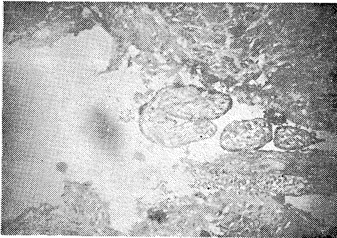
عکس شماره ۳- نمای میکروسکوپی پلاسنٹا اکرتا - پرزهای کوریون بدون رشته‌های عضلانی نفوذ کرده‌اند.