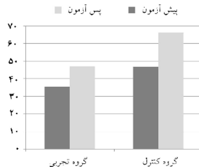
نمودار ۱- بیان ژن ابستاتین در دو گروه قبل و بعد اجرای پروتکل تمرینی

هدف از پژوهش حاضر بررسی اثر یک جلسه تمرین هوازی بر بیان ژن ابستاتین لنفوسیت زنان تمرین کرده بود. نتایج تحقیق حاضر نشان داد که یک وهله تمرین هوازی سبب افزایش معنی‌داری در بیان ژن ابستاتین لنفوسیت‌ها نمی‌گردد. در این زمینه، Ghanbari-Niaki به بررسی اثر یک جلسه تمرین با شدت‌های مختلف بر سطوح پلاسمایی ابستاتین پرداخت، نتایج این پژوهش حاکی از آن بود که سطوح ابستاتین پلاسمای در پاسخ به یک جلسه تمرین مقاومتی در هیچ‌یک از شدت‌های مختلف تمرین، تغییر معنی‌داری نیافت. ۱۹ Manshourی به بررسی اثر یک برنامه تمرین بی‌هوازی کوتاه‌مدت بر