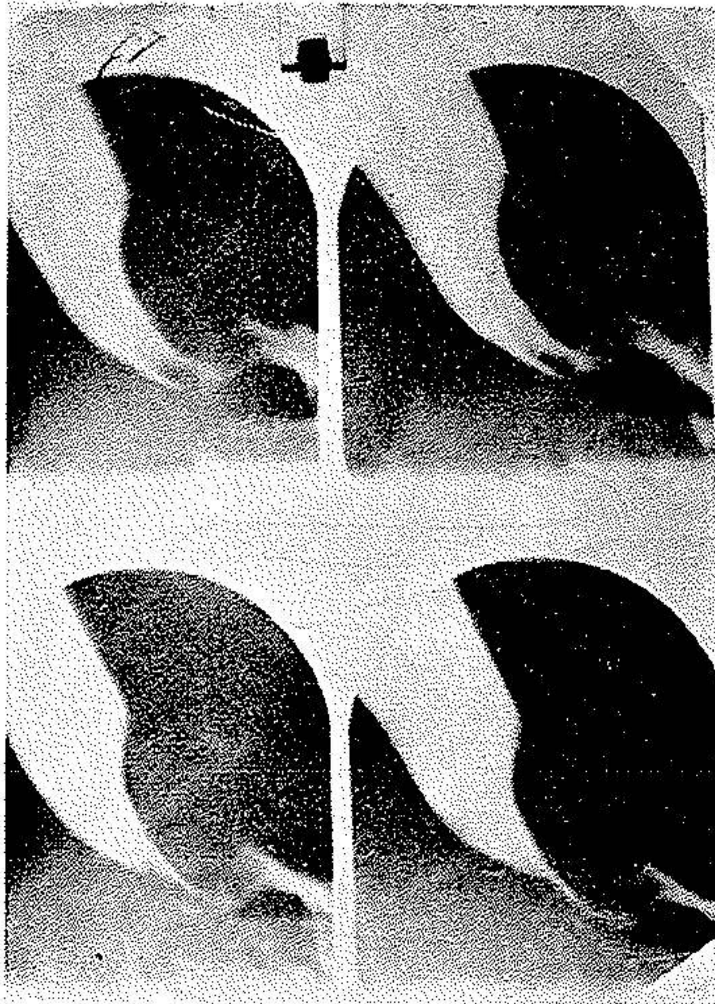
شکل ۴ - رادیوگرافی بیمار قبل از عمل بای پاس

با مایعات شروع شد و تغذیه باغذای معمولی از روز چهاردهم انجام گرفت. کنترل رادیوگرافی (ع و ه) دو هفته بعد از عمل نشان داد که ساده حاجب