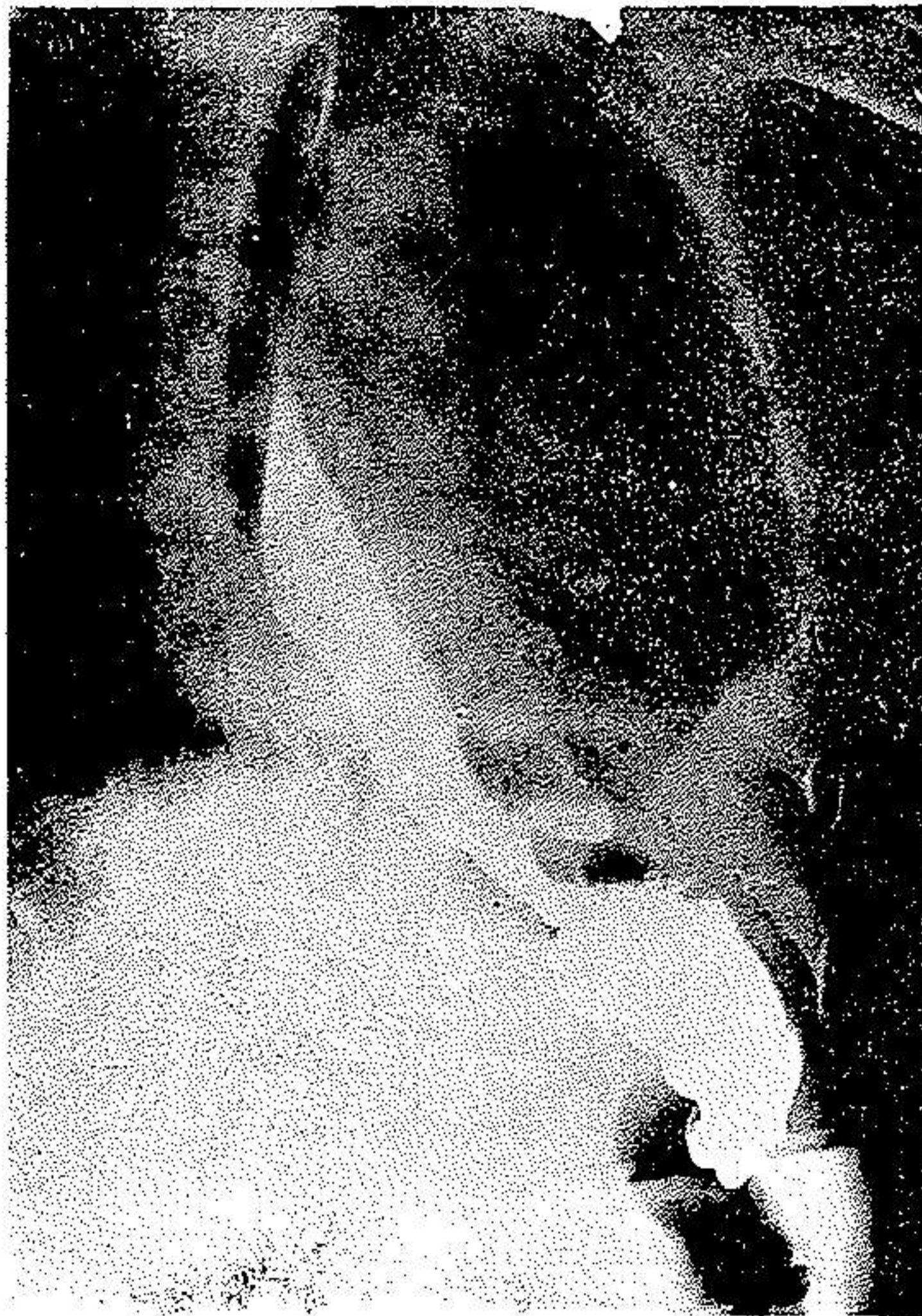
شکل ۵ - رادیوگرافی بیمار ۲ هفته بعد از عمل بای پاس

در کولون راست قوسهای وریدی ثابت نیستند و وریدها خیلی دور از کولون بهم پیوندند. این موضوع آناتومیك باعث شده است که در چند مورد که کولون